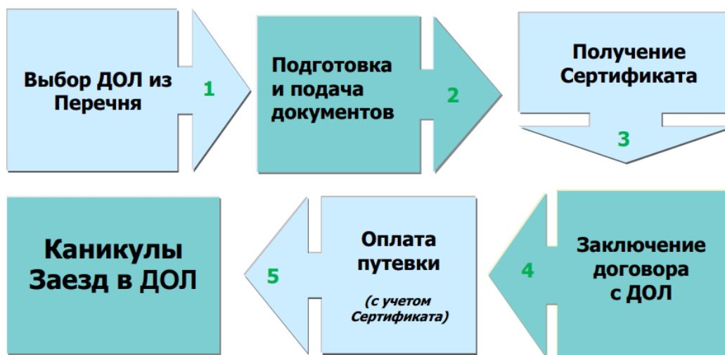
Рисунок 1. Порядок приобретения путевок в ДОЛ в Санкт-Петербурге.

Порядок приобретения путевок в детские оздоровительные лагеря (далее – ДОЛ) для детей работающих граждан представлен на рис. 1.